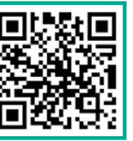
청음복지관 이용 방법 안내